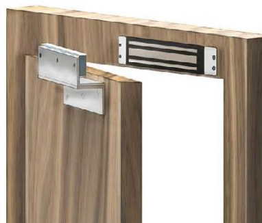
B1012 - L&Z 支架