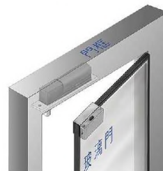
U-200 / UG201