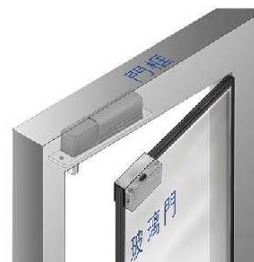
U-200 / UG201